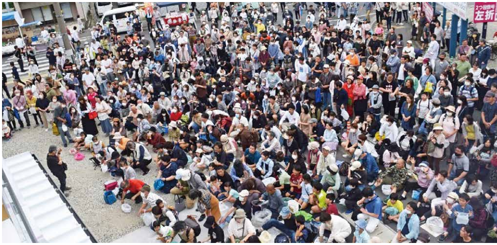
餅投げに集まった大勢の人々、新会館大いに沸く。

当日は大勢の方々にお集まりいただき、盛大に餅投げイベントを開催することができました。今後は市民の方々も気軽に会館を利用していただき、「誰にでも開かれた商工会議所」を目指していきます。