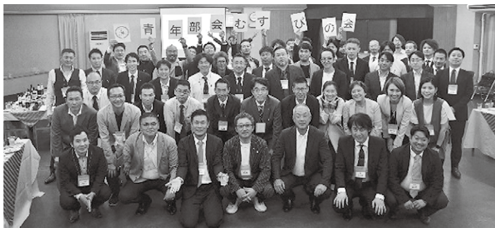
左上:平野会長挨拶 右上:例会の様子 下:懇親会後の集合写真)