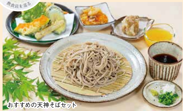
おすすめの天神そばセット